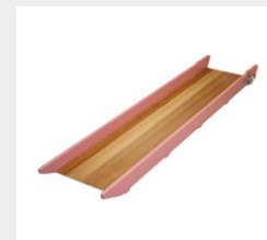
・巧技台®すべり面×1